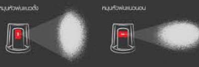
ละอองการพ่น 1 ครั้ง

■ หัวพ่น Turbo Fan ให้รูปแบบการพ่นลักษณะแบน กระจายวงกว้าง ขนาด 5 ซม. (ที่ความห่างในการพ่น 20 ซม.) เหมาะสำหรับชิ้นงานใหญ่ที่ต้องการพ่นให้เต็มพื้นที่ด้วยความรวดเร็ว ปรับทิศทางได้ กิ่งแนวตั้งและแนวนอน