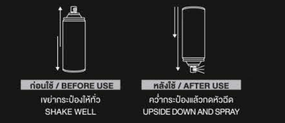
ก่อนใช้ / BEFORE USE เขย่ากระป๋องให้ทั่ว SHAKE WELL หลังใช้ / AFTER USE คว่ำกระป๋องเสียดหัวพ่น UPSIDE DOWN AND SPRAY