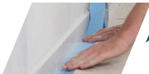
③ Cleaning & Protection area