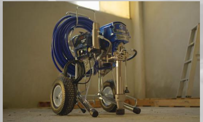
GRACO MARK VII ULTRA MAX PRO