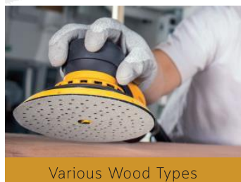
Various Wood Types