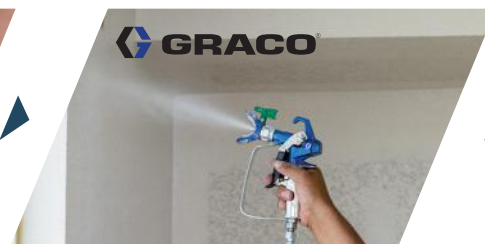
④ Primer 1 coat