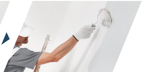
⑥ 2 nd Topcoat