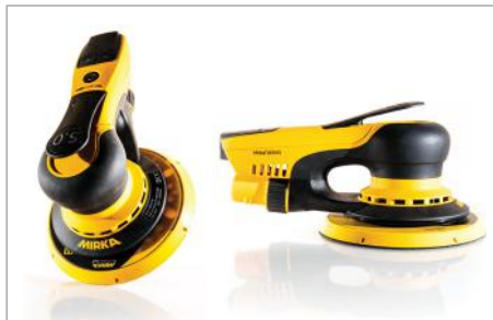
Light weight, only 3.5 kg