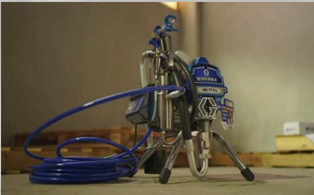
GRACO 495 ULTRA MAX PRO