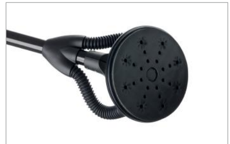
Dust-free & Easy to use