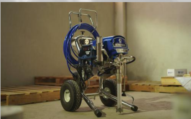
GRACO 695 ULTRA MAX PRO