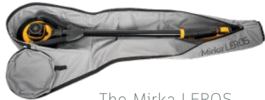
The Mirka LEROS transport and storage bag.