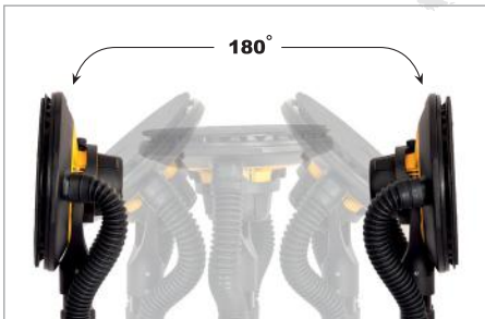
180 Flexible sanding head