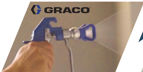
① Skim coat