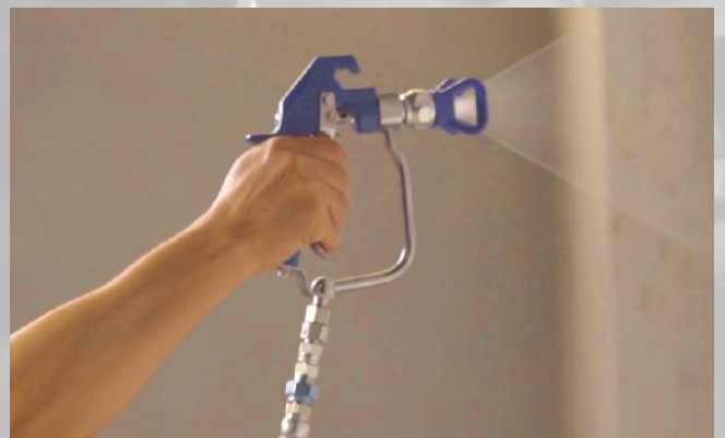
ปืนพ่นสี (Texture Gun)