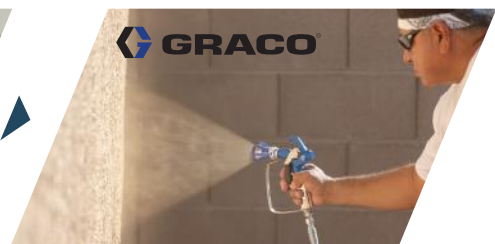
⑤ Topcoat 1 coat

“Get more productivity by professional machine innovation of coating system”