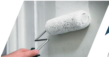
④ Primer 1 coat