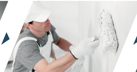
⑤ 1 st Topcoat