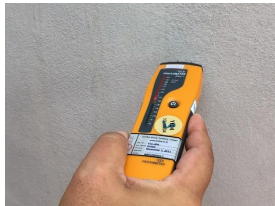
เครื่องวัดความชื้นรุ่น Protimeter Mini