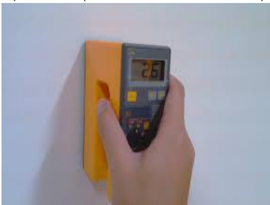
เครื่องวัดความชื้นรุ่น HI-520

สำหรับพื้นปูน: พื้นผิวต้องสะอาดไม่มีฝุ่น สิ่งสกปรก คราบไข สิ่งแปลกปลอม ต้องมีค่าความชื้นไม่เกิน 6% (วัดด้วยเครื่อง HI-520) หรือ 14% (วัดด้วยเครื่อง Protimeter Mini) และต้องมีค่าความเป็นด่างไม่เกิน 8