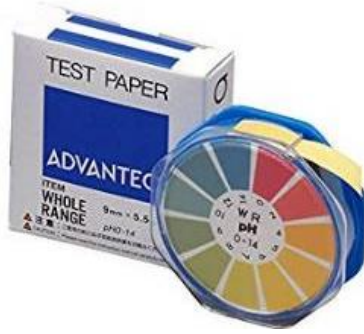
กระดาษวัดค่าความเป็นด่าง

สำหรับพื้นผิวเหล็กและโลหะ: ชัดฟิล์มสีเดิม สนิม สิ่งสกปรกต่าง ๆ ออกจนหมด เช็ดด้วยทินเนอร์ จนสะอาด ปราศจากฝุ่นละออง คราบสกปรก คราบไขมันหรือสิ่งแปลกปลอมอื่น ๆ และแห้งสนิท