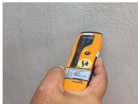
เครื่องวัดความชื้นรุ่น Protimeter Mini