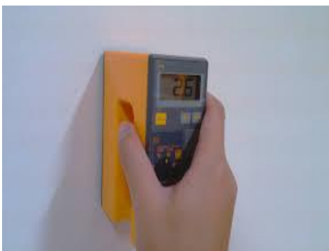
เครื่องวัดความชื้นรุ่น HI-520

สำหรับพื้นผิวใหม่: (ทิ้งปูนแห้งตัวไม่ต่ำกว่า 28 วัน) พื้นผิวต้องสะอาดไม่มีฝุ่น สิ่งสกปรก คราบไขมัน สิ่งแปลกปลอม ต้องมีค่าความชื้นไม่เกิน 6% (วัดด้วยเครื่อง HI-520) หรือ 14% (วัดด้วยเครื่อง Protimeter Mini) และต้องมีค่าความเป็นด่างไม่เกิน 8