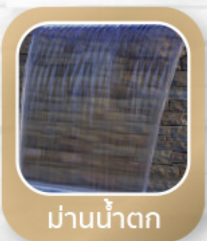
ม่านน้ำตก

ผลิตภัณฑ์เคลือบเงา กันซึม สีใส สูตรน้ำมัน สูตรป้องกันเชื้อรา ตะไคร่น้ำ ทนต่อแสงยูวี