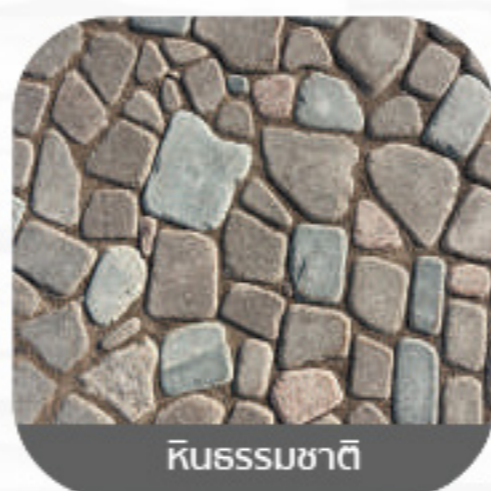
หินธรรมชาติ