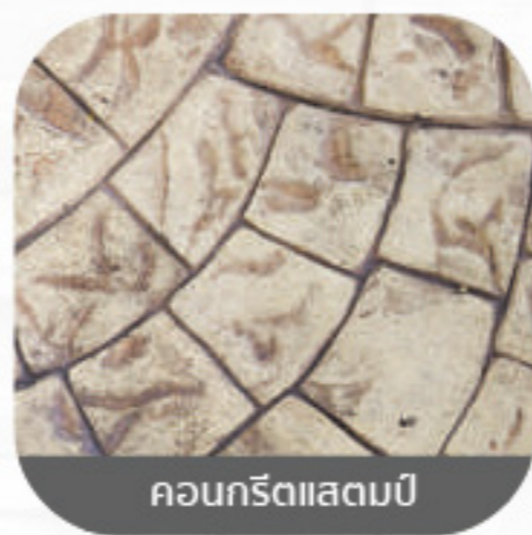
คอนกรีตเสตมปี