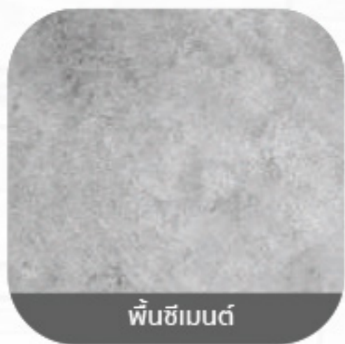
พื้นซีเมนต์