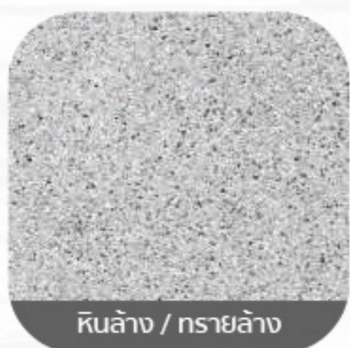
หินล้าง / ทรายล้าง