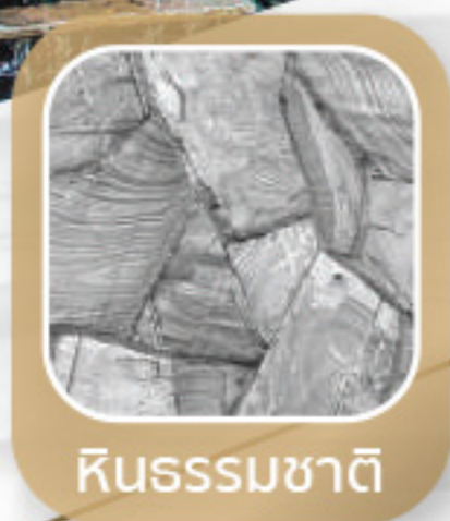
หินธรรมชาติ