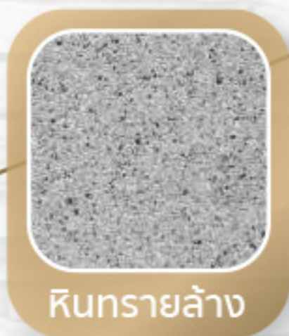
หินทรายล้าง