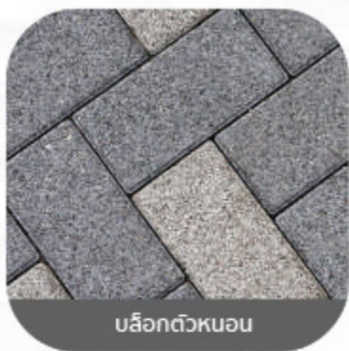
บล็อกตัวหนอน