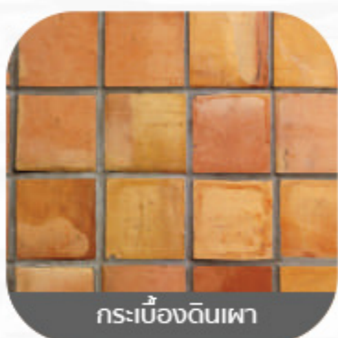
กระเบื้องดินเผา